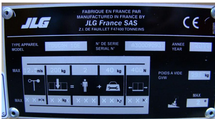
Deze markeringen zijn conform

Voor de CE-markering als bewijs van conformiteit met de Machinerichtlijn kan worden gekozen voor scenario A of scenario B.