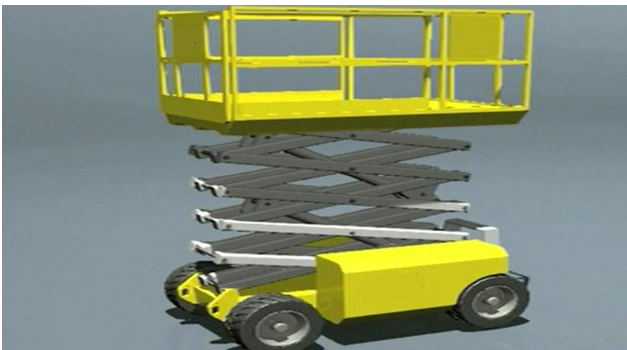
Hoogwerker met schaarmechanisme