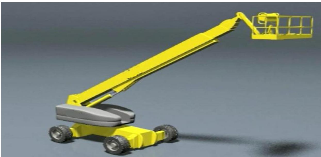
Hoogwerker met telescoopwerking