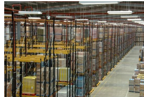
Rayonnage - stockage