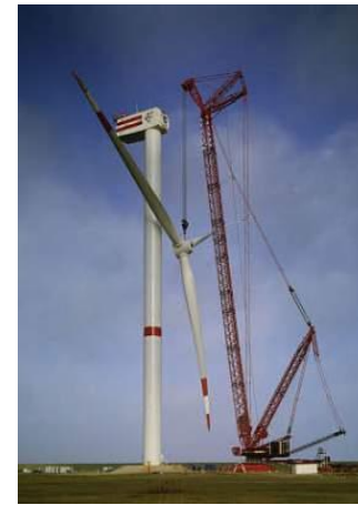
Grues & équipements de levage