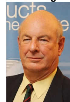
Tony Gresham Jones Whittan Storage Systems