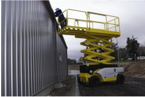
Plateformes élévatrices mobiles de personnel