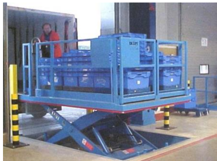
Équipement de mise à niveau