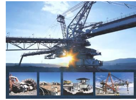
Convoyeurs à bande